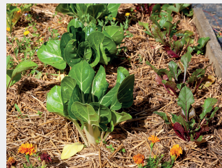
Rangs de blettes et betteraves entourés de paillage

C'est un procédé très simple qui consiste à recouvrir le sol avec les restes de tailles des végétaux et qui permet de : ✓ Réduire la pousse des mauvaises herbes et l'utilisation de produits chimiques. ✓ Nourrir le sol avec un amendement organique. ✓ Limiter l'évaporation de l'eau présente dans le sol et donc l'arrosage. ✓ Protéger les plantations du gel.