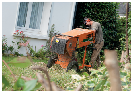
Broyage à domicile

Faites un tas de déchets verts, avancez la tondeuse en surélevant les roues avant puis, de nouveau avancez la tondeuse en la baissant progressivement en fonction du bruit du moteur. Si le moteur menace de caler, relevez les roues avant. Répétez l'opération plusieurs fois jusqu'à obtenir un format de broyat adapté au paillage ou au compostage (plus le broyat est fin, plus il se composte facilement).