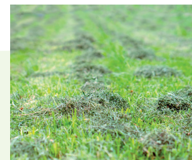
Résidus de tonte