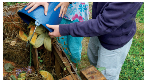
Atelier de compostage en école primaire

C'est une technique simple qui consiste à transformer vos déchets verts en un fertilisant naturel pour le jardin. Voici les étapes clés pour un bon compostage des déchets verts :