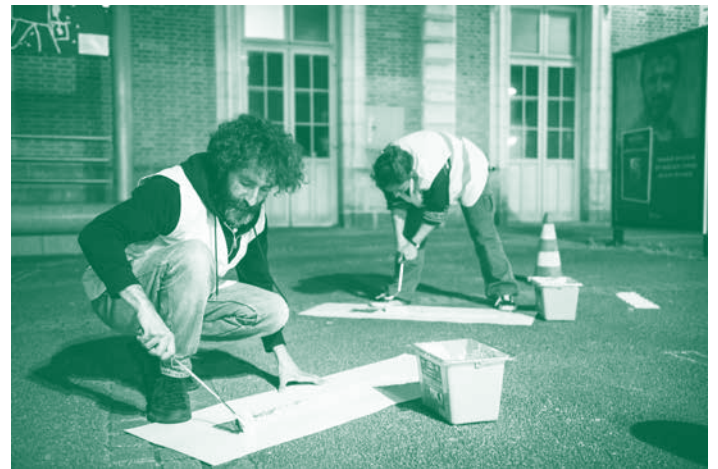
Peinture de la fresque de nuit @Jean-Jacques Banide - QBO