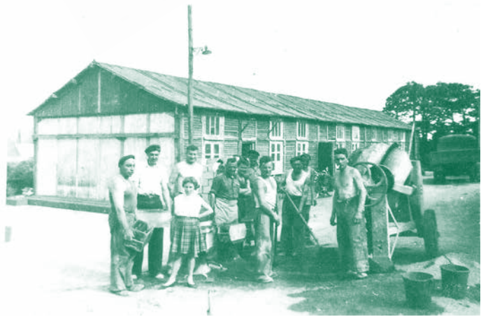
Les castors du rail en action. Photographie des années 1950.

À l'image d'autres autoconstructions coopératives, les membres de la société apportent chacun leur savoir-faire pour mener à bien le projet. Chaque sociétaire doit fournir 36 heures de travail mensuelles, être présent deux dimanches par mois et consacrer deux semaines de congés annuels au chantier, durées qui augmentent progressivement. Ainsi, les cheminots procèdent au défrichage de la parcelle, à l'empierrement et au terrassement de la route. Ils extraient les pierres dans une carrière à Plomelin, fabriquent eux-mêmes 20 000 parpaings. La solidarité est de mise, le règlement prévoyant qu'en cas de décès de l'un des membres de la société, les autres « Castors » s'engagent à terminer le chantier pour sa veuve. Les premiers habitants emménagent en 1955. La rue de Rozolen témoigne encore aujourd'hui de cette épopée cheminote et collective d'après-guerre.