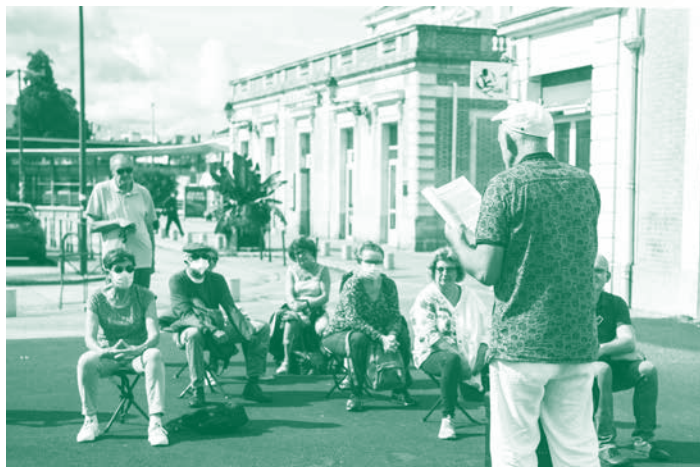
La traversée du présent. Rendez-vous de la Gare 2021