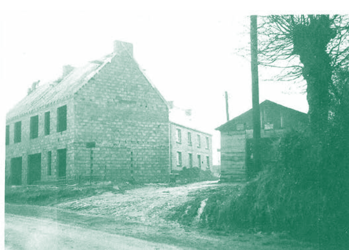
Les maisons en chantier. Photographie des années 1950.