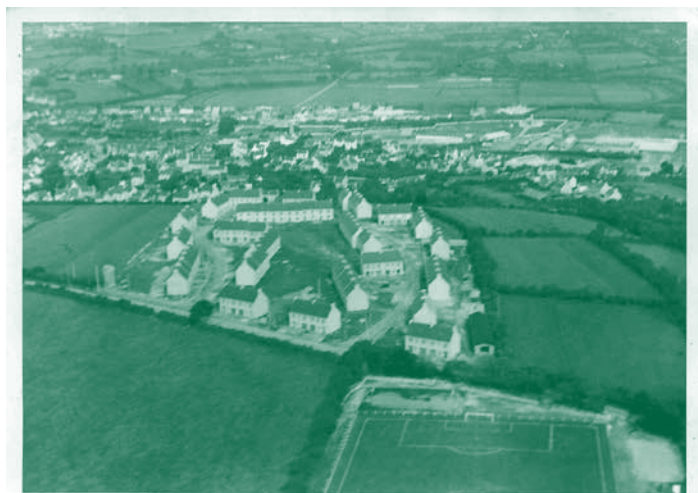
La cité des Castors du rail à Ergué-Armel (aujourd'hui rue de Rozulen). Vue aérienne du milieu des années 1950.

La société, dont le siège est situé rue Saint-Julien à Ergué-Armel, voit ses actions réparties entre 71 cheminots. Elle est administrée par un conseil de douze membres tirés au sort puis renouvelé par tiers. Régie par un règlement qui fixe les montants à verser au début du projet et mensuellement, la société des Castors du rail facilite l'épargne des actionnaires et l'obtention d'un prêt de 119 millions d'anciens francs. Cependant, elle bénéficie aussi de primes à la construction de la part de l'État et d'aides directes de la commune d'Ergué-Armel (bitumages, revêtements, pose de canalisations d'eau et d'électricité). Cette coopérative d'autoconstruction constitue un moyen d'accéder à la propriété pour une classe ouvrière modeste, avec un type d'habitat considéré comme du logement social. Lancé en 1953, sur une parcelle agricole de plus de trois hectares au lieu-dit de Rozolen, le chantier de la cité des Castors du rail dure trois ans. 71 maisons sortent de terre, élevées sur une cave, avec une pièce de plain-pied et un faux grenier, et toutes équipées du confort moderne.