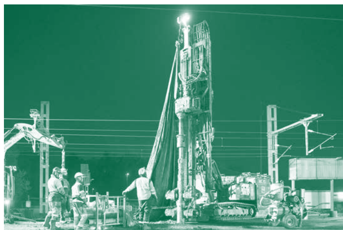
Finalisation des micro-pieux de nuit

Les fondations de la passerelle ont été finalisées fin mai. Les ouvriers ont travaillé de nuit pour pouvoir intervenir sur les quais de la gare. À partir de juin et jusqu'à mi-août, les différents éléments de la passerelle seront posés (les piles et les escaliers de la passerelle).