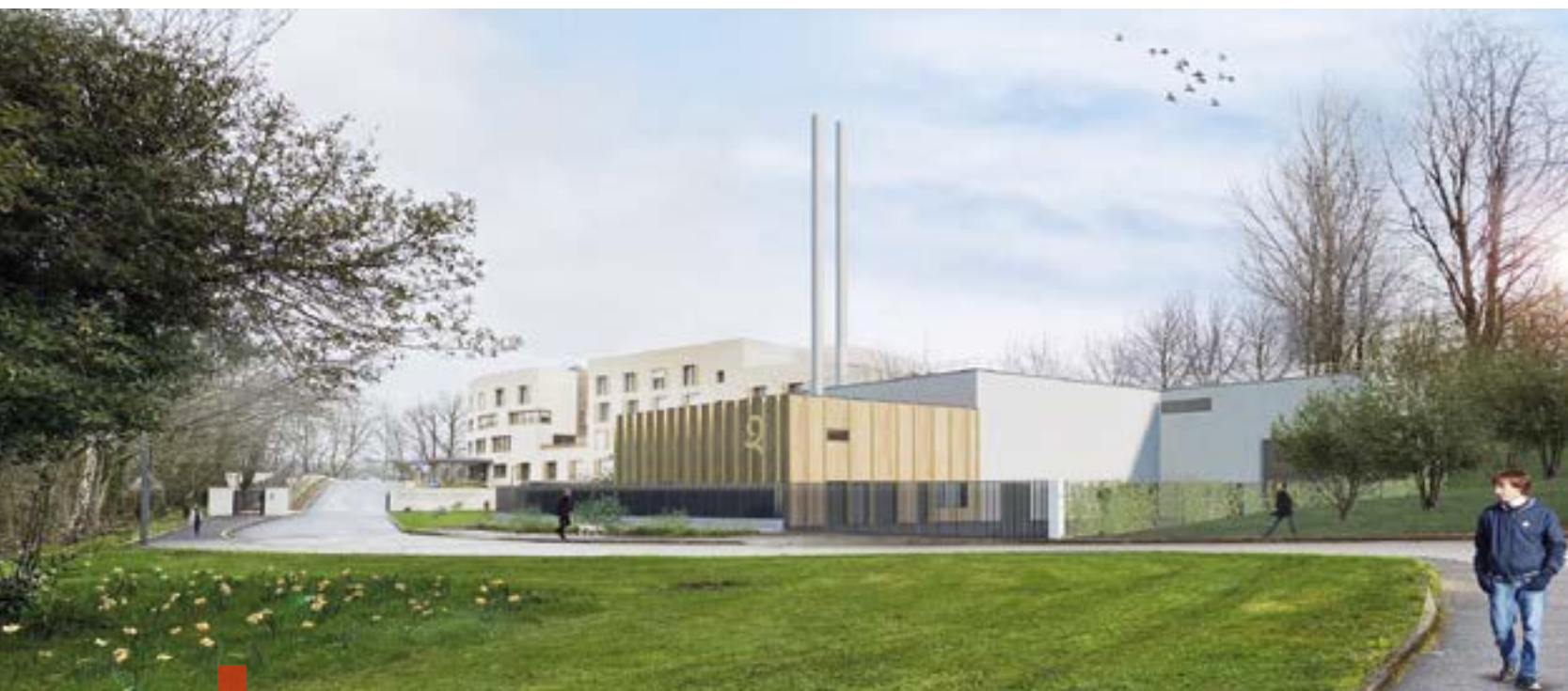
Le réseau de chaleur à Penhars entrera prochainement en service.

Adopté à l'unanimité en 2022, le projet de territoire de Quimper Bretagne Occidentale est la boussole de l'action communautaire. Son objectif est clair : répondre aux besoins immédiats des habitants tout en préparant l'avenir. Dans un contexte de crises multiples – climatique, énergétique, sociale – ce projet a démontré sa pertinence. Il sera actualisé, mais ses priorités demeurent : agir concrètement et accélérer les transformations.