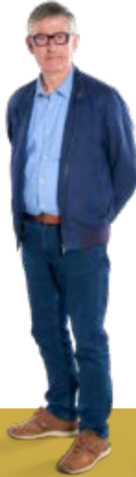
■ Ronan Le Menn Maire de Quéménéven Délégué à la gestion durable des déchets